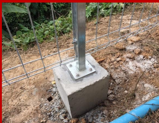
การติดตั้งเสา