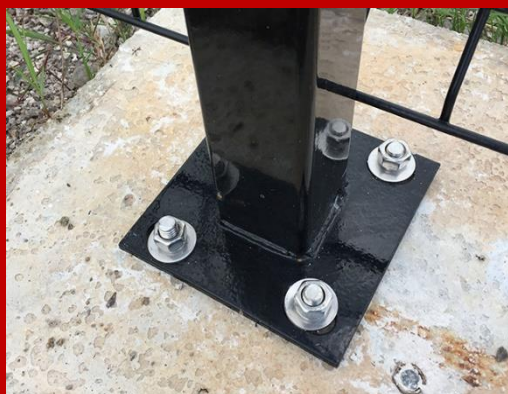
การติดตั้งเสา